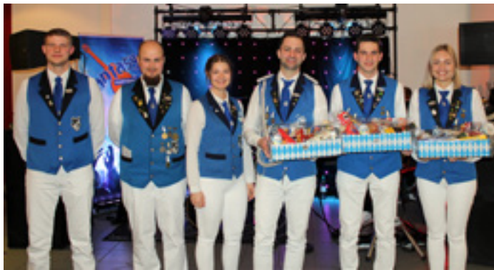
Die Geehrten des Spielmannszuges

Im Anschluss an das gemeinsame Essen, wurden 15 Mitglieder für Ihre langjährige Mitgliedschaft und Vereinstreue geehrt. Zusätzlich gab es drei Ehrungen beim Spielmannszug Herzlake.