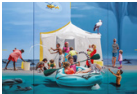
Das Misereor-Hungertuch 2025/2026 „Liebe sei Tat“ von Konstanze Trommer - © Misereor

Ab Aschermittwoch wird in unseren Kirchen und in der St. Antonius Kapelle Westrum das diesjährige Hungertuch zu sehen sein. Zusätzlich wird es Materialien zur Erklärung und Gebete zum Thema „Liebe sei Tat“ geben. In den Gottesdiensten in der Fastenzeit wird das Hungertuch punktuell thematisiert. Schauen Sie gerne vorbei!